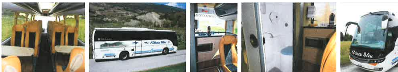
Les photos sont indicatives.

Toute modification de programme reste réservée.