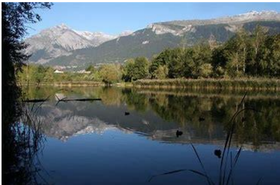
Le lac de Montorge Sion

à notre Assemblée Générale et à notre Repas de chasse